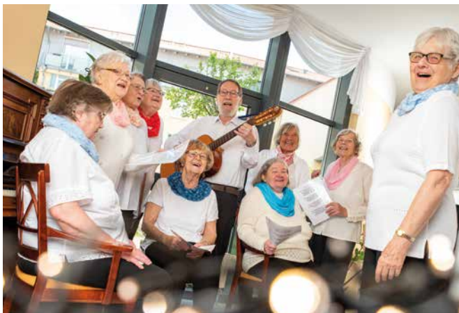
Gepflegte Unterhaltung bei zahlreichen Ausflügen und Veranstaltungen

In familiärer Atmosphäre erleben unsere Bewohner aktivierende Pflege und Betreuung sowie ein außergewöhnlich großes, vielseitiges Beschäftigungs- und Veranstaltungsangebot mit regelmäßigen Ausflügen.